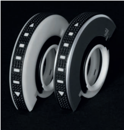
Bild 1. 3K Bedienrad mit galvanischem Überzug zur Regulierung eines Ausströmers